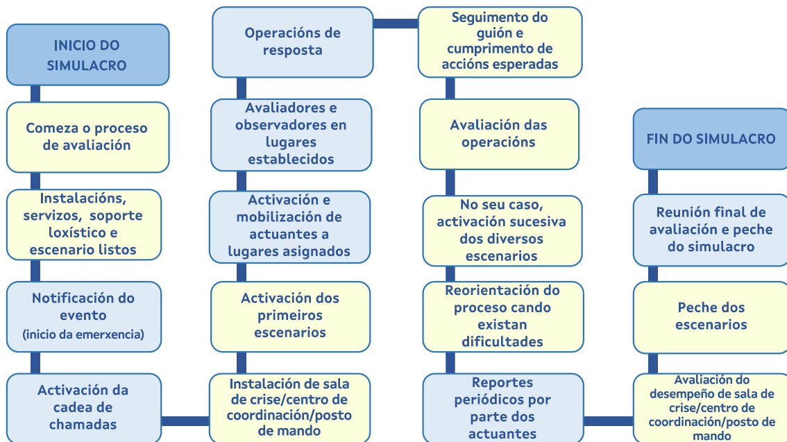
Figura 3. Secuencia tipo de execución dun simulacro

Nos momentos previos ao inicio do exercicio ou simulacro, deberán de designarse persoas para apoiar accións específicas, que poden ser, entre outras: