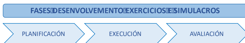
Figura 1. Fases para o desenvolvemento de exercicios e simulacros

En xeral, as diferentes etapas que compoñen o desenvolvemento de exercicios e simulacros son as seguintes: